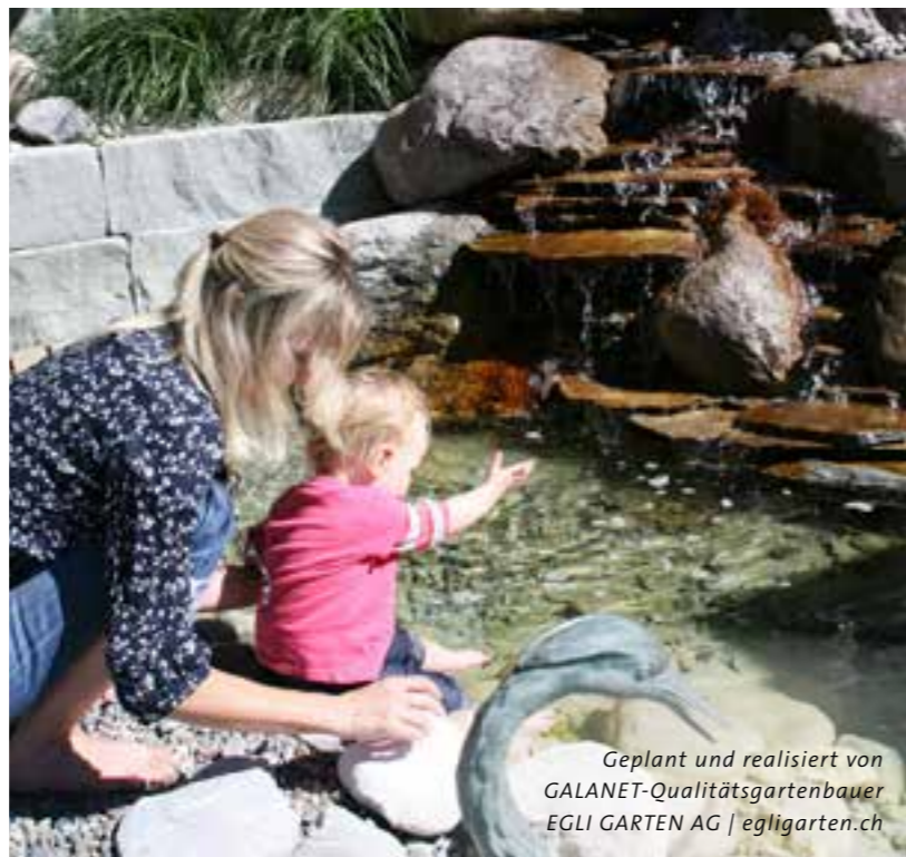
Geplant und realisiert von GALANET-Qualitätsgartenbauer EGLI GARTEN AG | egligarten.ch

Im kleineren Stil bedeutet aber nicht, dass es nicht genauso schön sein kann. Auf die Größe kommt es nämlich nicht an. Das leise Plätschern eines Bachlaufs, der rauschende Wasserfall, ein idyllisch angelegter Teich, ein kleiner Brunnen – wichtig ist lediglich, dass sich die Wasseranlage gut in die Gartengestaltung einfügt. Dies kann übrigens wunderbar auch im Nachhinein geschehen, um einen bestehenden Garten aufzuwerten.