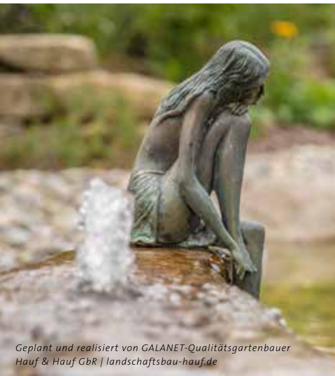
Geplant und realisiert von GALANET-Qualitätsgartenbauer Hauf & Hauf GbR | landschaftsbau-hauf.de