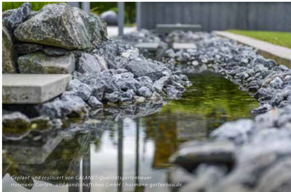
Geplant und realisiert von GALANET-Qualitätsgartenbauer Husmann Garten- und Landschaftsbau GmbH | husmann-gartenbau.de