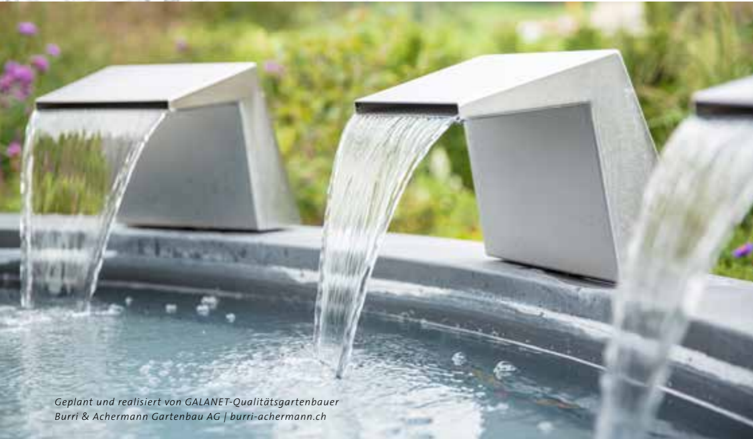
Geplant und realisiert von GALANET-Qualitätsgartenbauer Burri & Achermann Gartenbau AG | burri-achermann.ch

Es muss nicht immer ein großer Pool oder ein Schwimmteich sein. Wer Wasser in seinen Garten integrieren möchte, kann das auch im kleineren Stil.