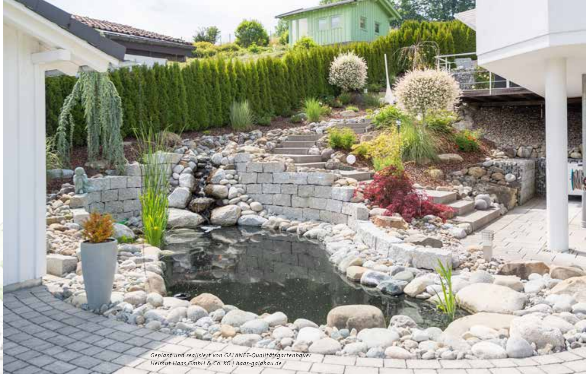
Geplant und realisiert von GALANET-Qualitätsgartenbauer Helmut Haas GmbH & Co. KG | haas-galabau.de