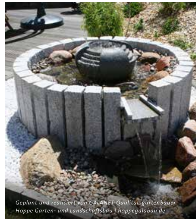
Geplant und realisiert von GALANET-Qualitätsgartenbauer Hoppe Garten- und Landschaftsbau | hoppegalabau.de

„Spüren Sie die Faszination Wasser auch in Ihrem eigenen Garten.“