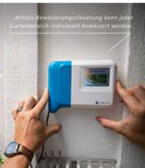
Mittels Bewässerungssteuerung kann jeder Gartenbereich individuell bewässert werden.

https://www.galanet.org/blog/praktisch-und-sparsam-automatische-gartenbewaesserung/