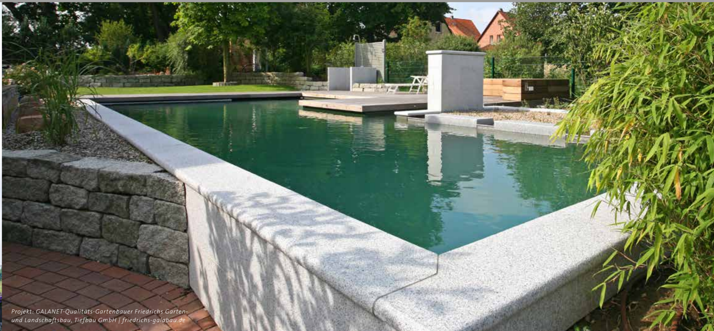
Projekt: GALANET-Qualitäts-Gartenbauer Friedrichs Garten- und Landschaftsbau, Tiefbau GmbH | friedrichs-galabau.de