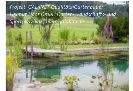
Projekt: GALANET-Qualitäts-Gartenbauer Helmut Haas GmbH Garten-, Landschafts- und Sportplatzbau | haas-galabau.de

Gärten sind individuell. Deshalb sind die Schwerpunkte, die wir in diesem Artikel nennen, selbstverständlich auch so zu behandeln. Ob Ihr Rasen zusätzlich noch eine Belüftung, Ihre Koikarpfen besondere Behandlung benötigen oder Ähnliches – das kommt ganz auf Sie, Ihren Garten und Ihre Gartenkenntnisse an. Und Sie wissen ja, wenn Sie Fragen haben, an wen Sie sich wenden können.